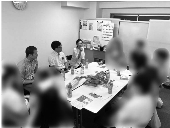
▲交流会では様々な質問が寄せられた

卒業3年目の参加者は、これまで関東に在住されており、今後、福岡へ移住予定とのこと。福岡県内の鍼灸事情を知りたいと参加されました。交流会後、入会にも前向きなお話をいただきました。