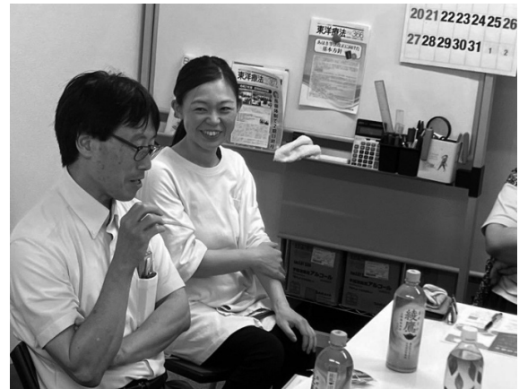
▲鍼灸師として経験してきた事を丁寧に語って頂いた

学生の皆さんからは、開業や経営、修行の実際など卒業後にに関する質問が多く寄せられました。メモを取りながら積極的に質問する姿が印象的で、非常に有意義な会となったと感じております。